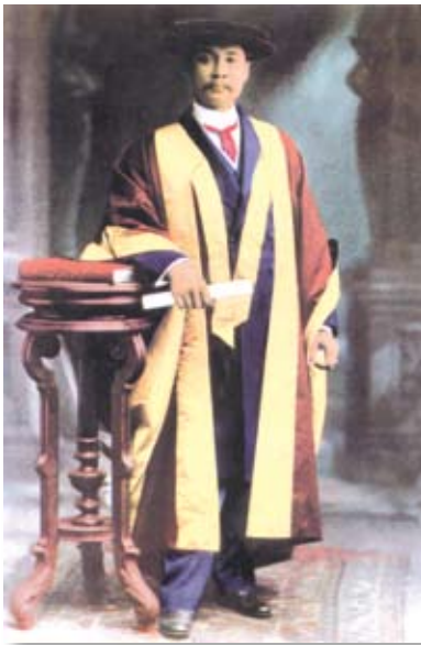
พระบาทสมเด็จพระจุลจอมเกล้าเจ้าอยู่หัว

ธงชาติเป็นสัญลักษณ์ที่มีความสำคัญมากของประเทศ ซึ่งเป็นสิ่งที่แสดงให้เห็นถึงความมีอิสรภาพของคนในชาติ เอกราชของประเทศ เป็นสิ่งที่ต้องเชิดชูให้เกิดความงามสง่า สร้างความภาคภูมิใจ เปรียบเสมือนศูนย์รวมแห่งความรักและความสามัคคีของคนในชาติ